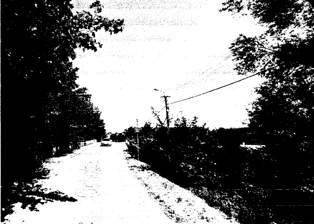
Rzeka Iłownica (widok z ul. Ochodzkiej)

Analiza zagrożeń, w tym identyfikacja miejsc, w których występuje zagrożenie dla bezpieczeństwa osób wykorzystujących obszar wodny do pływania, kąpania się, uprawiania sportu lub rekreacji na terenie Gminy Czechowice-Dziedzice.