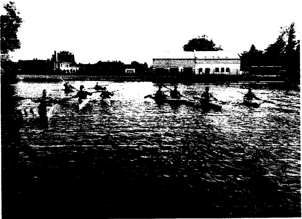
Kajakownia na „Kopalnioku” w Czechowicach-Dziedzicach

Analiza zagrożeń, w tym identyfikacja miejsc, w których występuje zagrożenie dla bezpieczeństwa osób wykorzystujących obszar wodny do pływania, kąpania się, uprawiania sportu lub rekreacji na terenie Gminy Czechowice-Dziedzice.