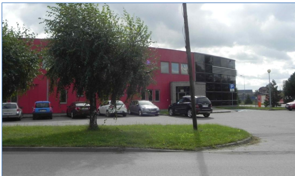
Zabudowa przy ulicy Michała Drzymały Obszar Nr 11