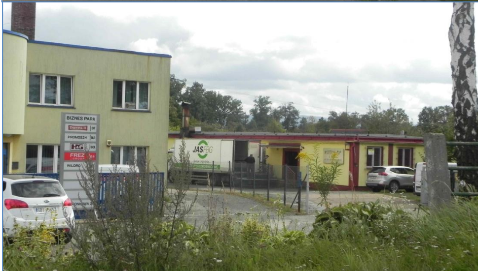
Zabudowa przy ulicy Pionkowej