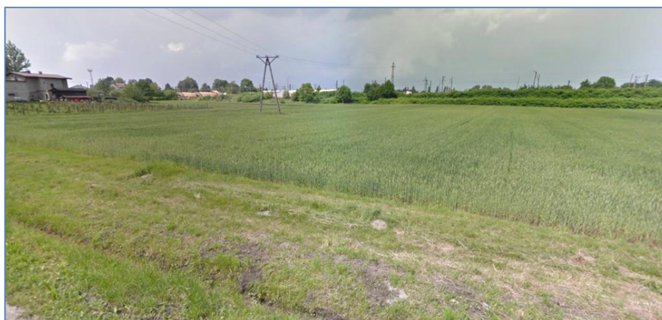
Tereny przy ulicy Marianki