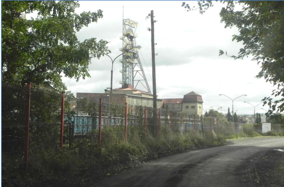
Zabudowa przy ulicy Nad Wisłą