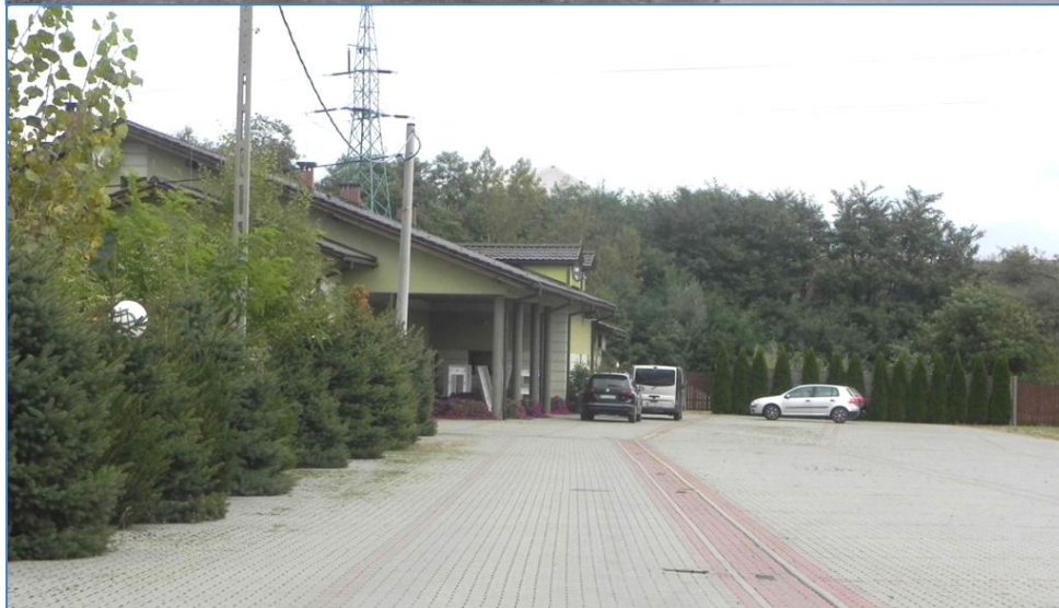
Zabudowa przy ulicy Nad Białką