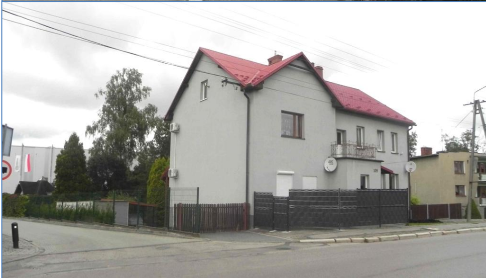
Zabudowa przy ulicy Górniczej