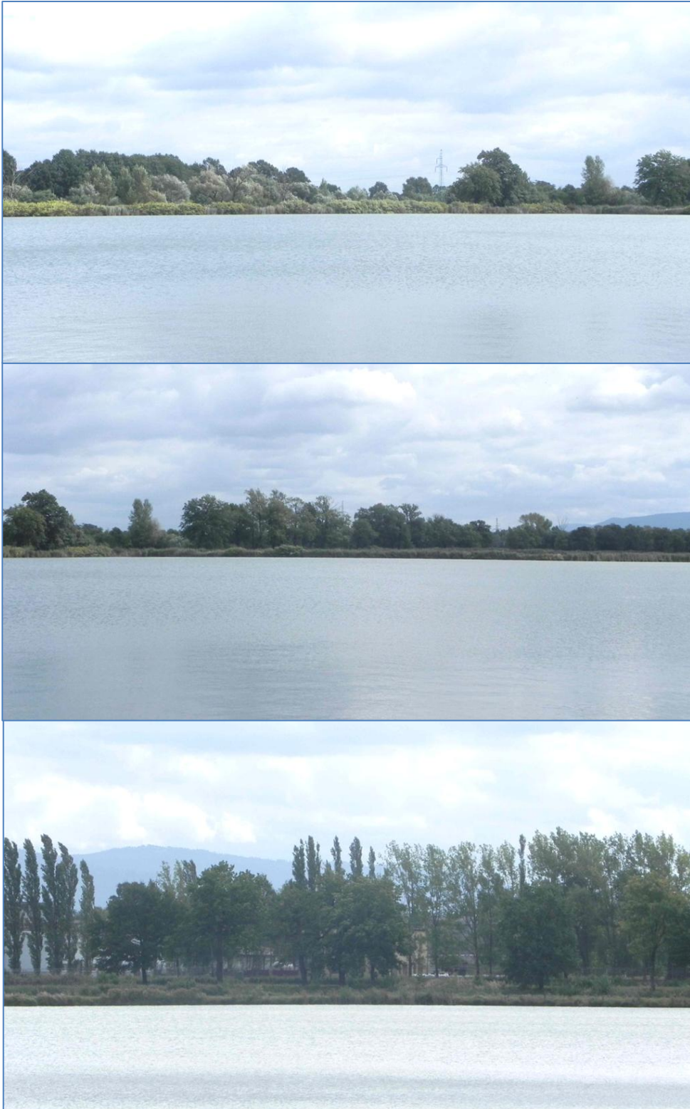
Obszar przy ulicy Nad Białą widok od strony ulicy Górniczej