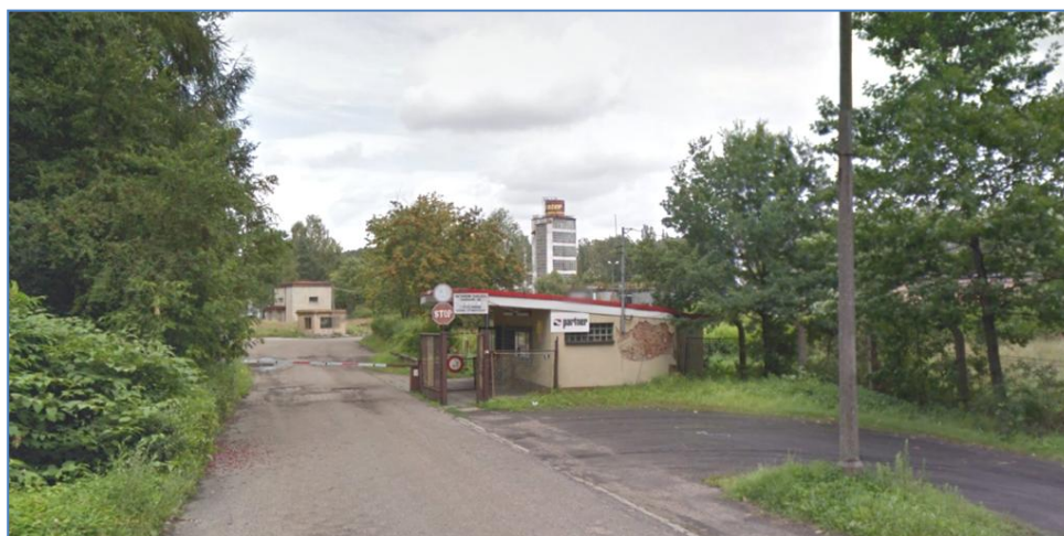
Obiekty przy ulicy Pionkowej