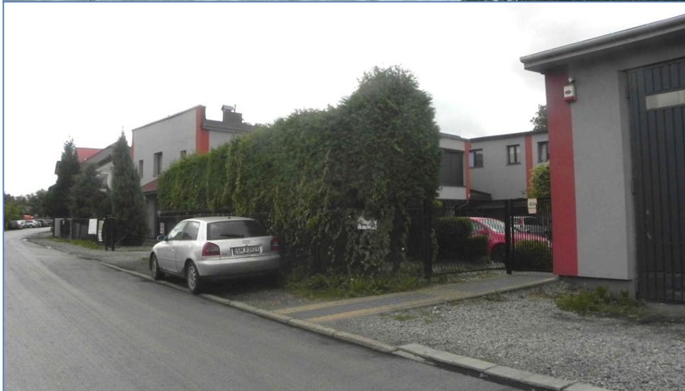
Zabudowa przy ulicy Nad Wisłą