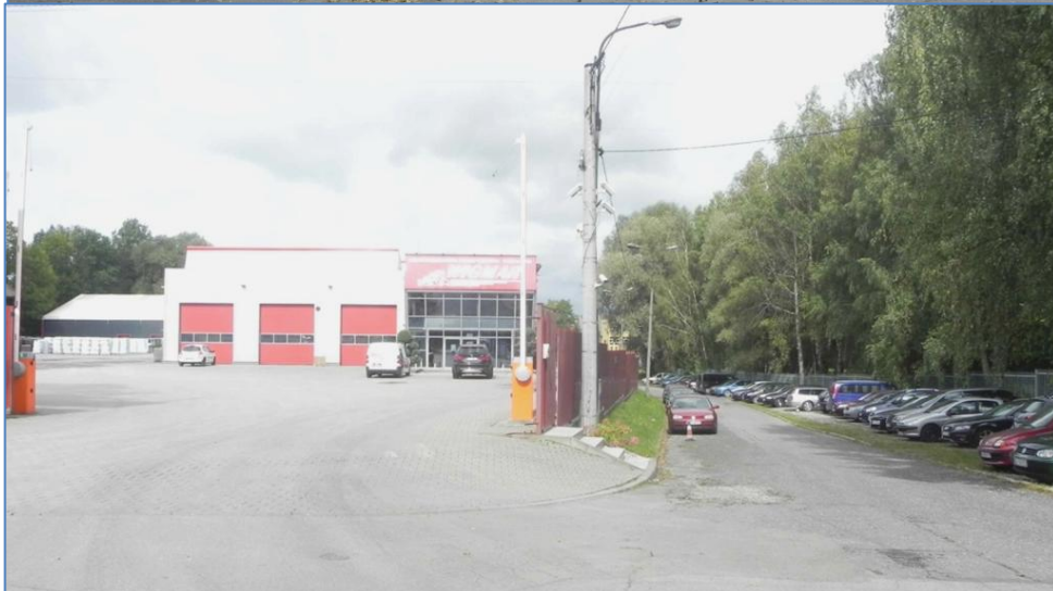
Zabudowa przy ulicy Kaniowskiej