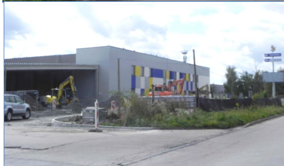
Zabudowa przy ulicy Michała Drzymały