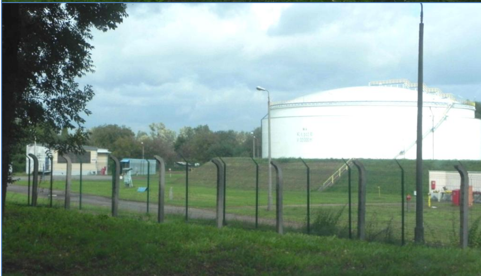
Zabudowa przy ulicy Zabiele