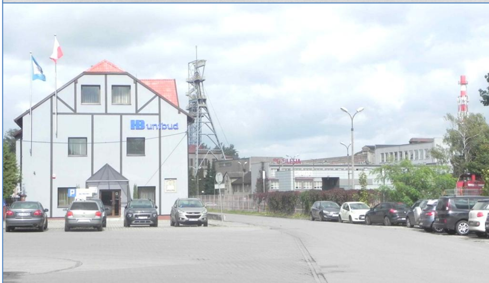
Zabudowa przy ulicy Górniczej i Nad Wisłą