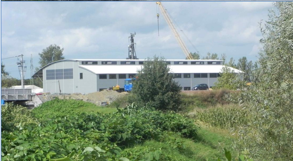
Tereny przy ulicy Czystej