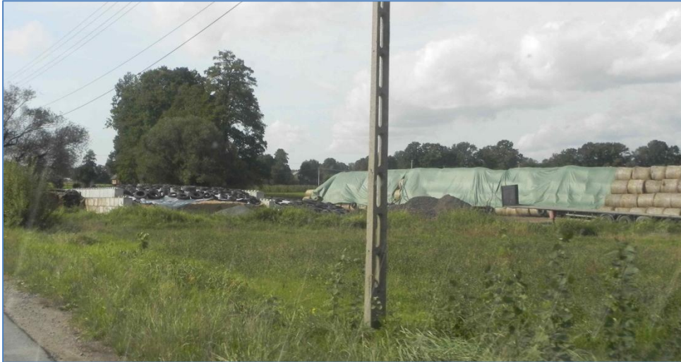
Tereny przy ulicy Ludwika Waryńskiego