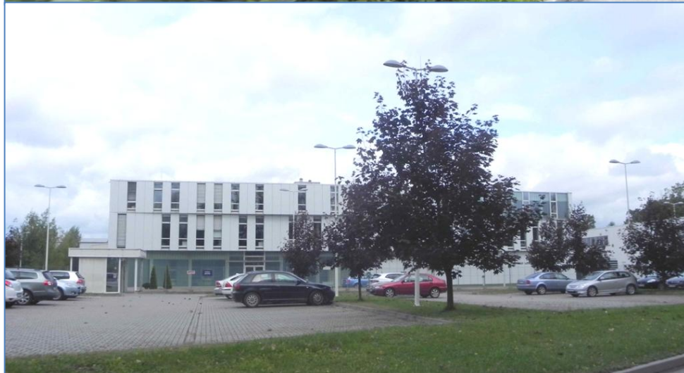
Zabudowa przy ulicy Górniczej i Nad Białą