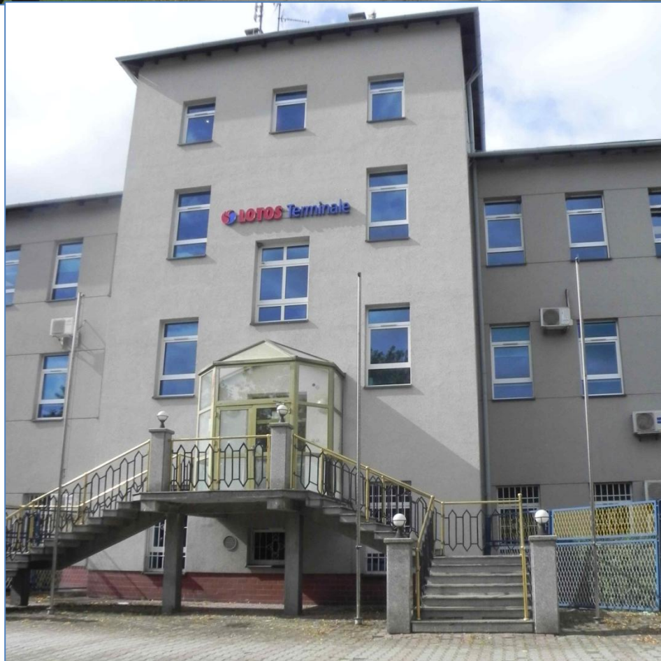
Zabudowa przy ulicy Ignacego Łukasiewicza