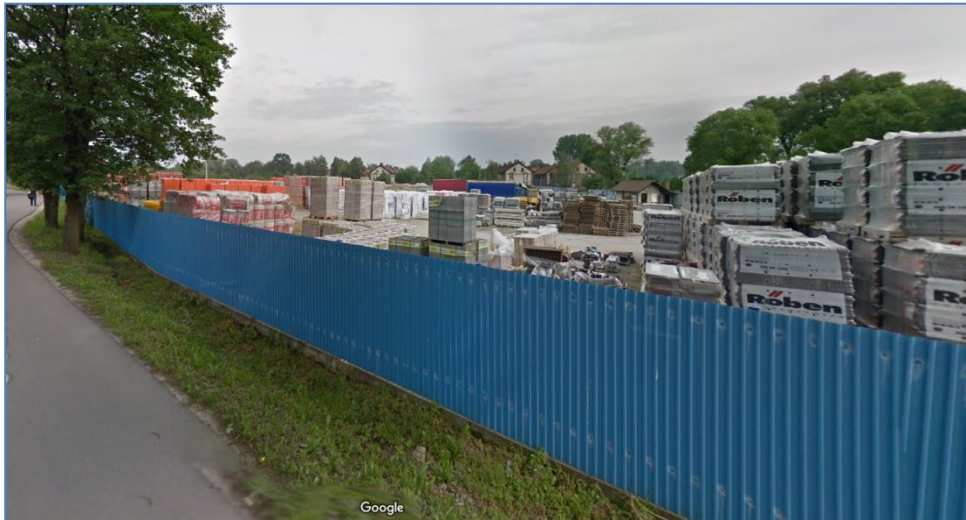
Zabudowa przy ulicy J. Rumana