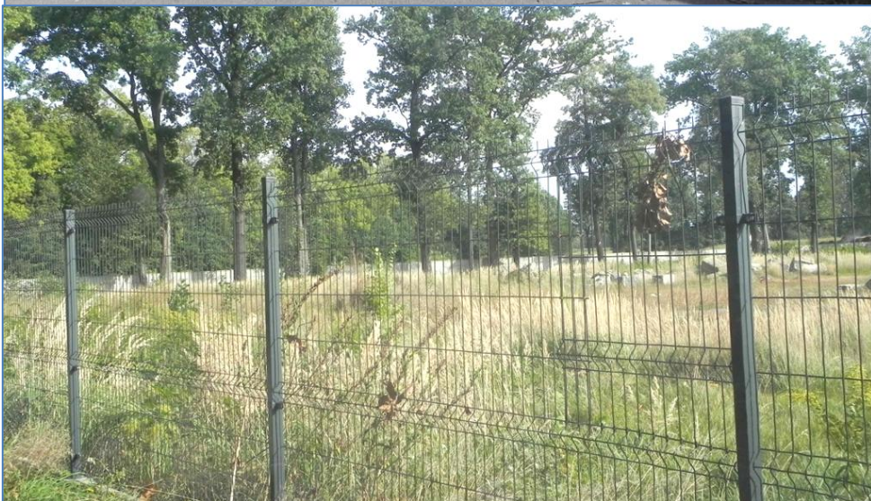
Zabudowa i tereny przy ulicy Ks. Janoszki