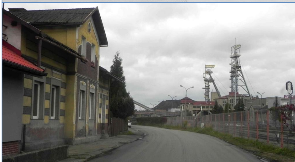
Zabudowa przy ulicy Nad Wisłą