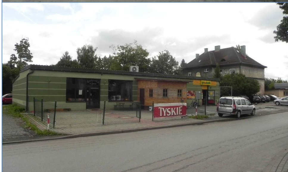
Zabudowa przy ulicy Górniczej