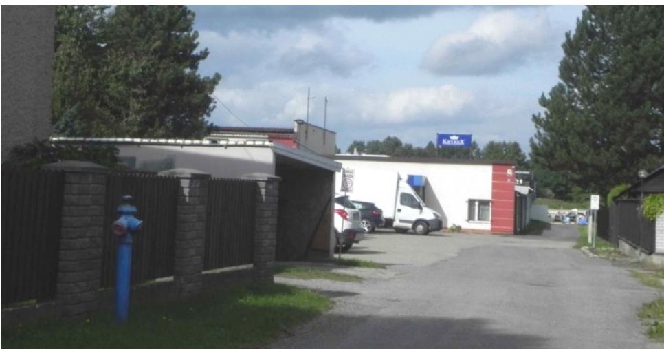
Zabudowa przy ulicy Łężnej