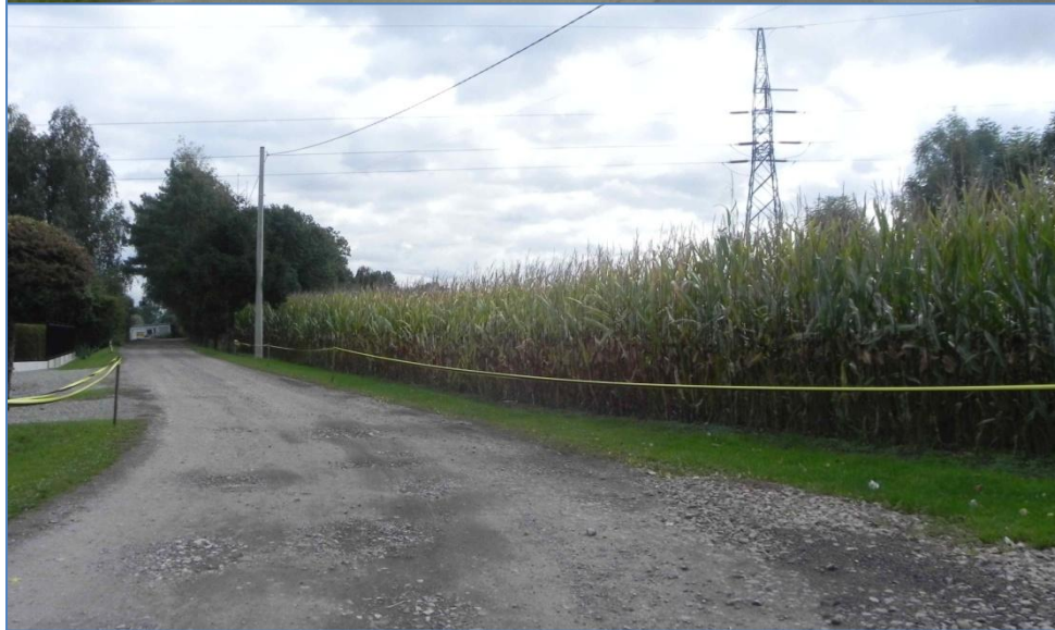
Zabudowa i tereny przy ulicy Kaniowskiej