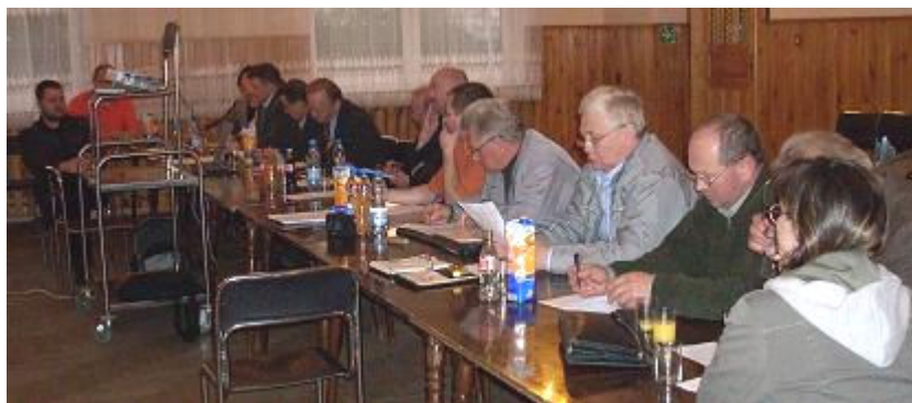
Przedstawiciele lokalnej społeczności Ligoty i samorządu Gminy Czechowice-Dziedzice w trakcie prac warsztatowych

24 kwietnia 2008 roku odbyły się w Ligocie warsztaty, w których wzięli udział mieszkańcy miejscowości oraz przedstawiciele gminnego samorządu. W czasie tego spotkania omówiono i zweryfikowano informacje przedstawione w poprzednich rozdziałach niniejszego opracowania, a także przeprowadzono analizę SWOT miejscowości. Ponadto omówiono problematykę planowanych zadań inwestycyjnych i przedsięwzięć aktywizujących społeczność lokalną.