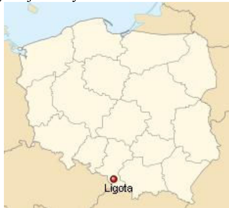
Ligota na mapie Polski

Ligota to wieś położona na południu Polski, w województwie śląskim, w powiecie bielskim. Jest sołectwem miejsko-wiejskiej Gminy Czechowice-Dziedzice.