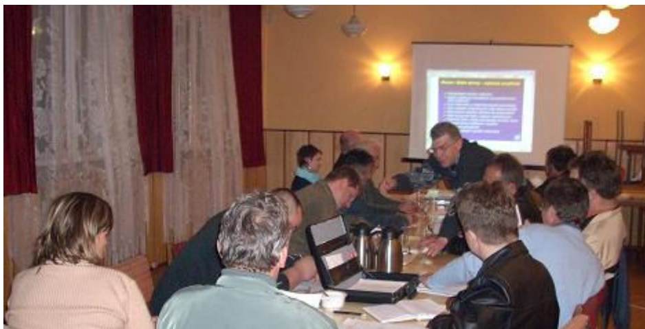
Przedstawiciele lokalnej społeczności Bronowa i samorządu Gminy Czechowice-Dziedzice w trakcie prac warsztatowych

21 kwietnia 2008 roku odbyły się w Bronowie warsztaty, w których wzięli udział mieszkańcy miejscowości oraz przedstawiciele gminnego samorządu. W czasie tego spotkania omówiono i zweryfikowano informacje przedstawione w poprzednich rozdziałach niniejszego opracowania, a także przeprowadzono analizę SWOT miejscowości. Ponadto omówiono problematykę planowanych zadań inwestycyjnych i przedsięwzięć aktywizujących społeczność lokalną.