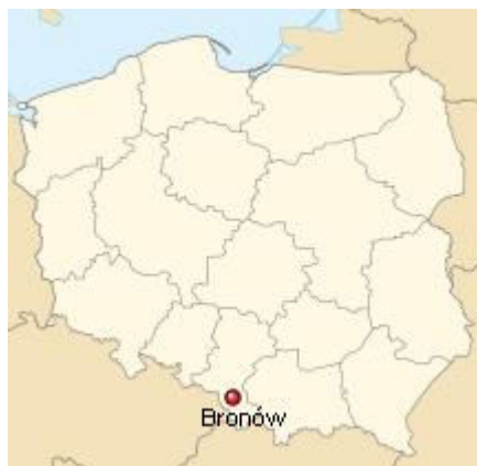
Bronów na mapie Polski

Bronów to wieś położona na południu Polski, w województwie śląskim, w powiecie bielskim. Jest sołectwem miejsko-wiejskiej Gminy Czechowice-Dziedzice.